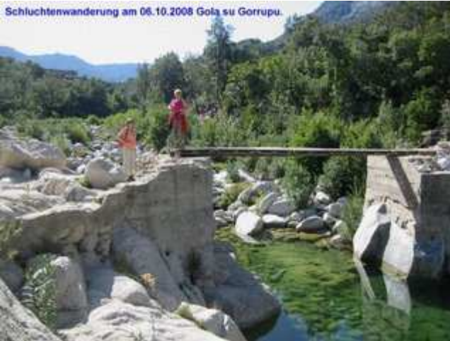
Schluchtenwanderung am 06.10.2008 Gola su Gorrupu.

Wo ist Korsika, das wollen wir doch mal sehen. Auf geht's nach Capo Testa. Bizarre Felsformationen aus Granit haben diesen Küstenstreifen geformt, und konnten sich nicht unserer Phantasie entziehen. Der nördlichste Teil der Insel hat