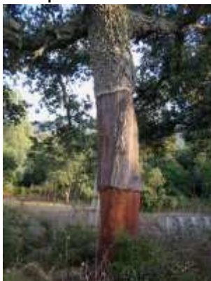
Foto dokumentiert. Ganz besonders hat sich uns die Korkeiche in Erinnerung gebracht. Viele Fragen machten dann die Runde. Die Ernten erfolgen alle neun bis zwölf Jahre wenn eine Schichtstärke von bis zu 4 Zentimeter erreicht ist. Insgesamt kann eine Ernte fünf bis zehnmal erfolgen. Eine Eiche liefert über ihre Lebensspanne etwa 100 bis 200 Kilogramm Kork. Wenn man bedenkt, dass erst nach der dritten oder vierten Ernte ein qualitativ hochwertiger Kork geliefert wird sieht man sozusagen alt aus. Eine anvisierte Kaffeepause in den kleinen Ort San Antonio de

Gallura wurde auf Grund der geschlossenen Lokalitäten nach Olbia verlegt. Für das Samstagabendbuffett, wurden noch Einkäufe getätigt, denn die Küche Angelo hat samstags Fiesta. Auf diese Art und Weise konnten wir reichlich Käse und Wein testen.