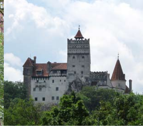
Bereit für die Burg Bran: Jan Ove, 13, und sein Vater mit Vampirzähnen aus Holz